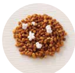
玄米 Brown Rice

和紅茶のやさしい香りと実山椒の清涼感あふれる香りが引き立て合うようなブレンドにこだわりました。口の中に広がる和紅茶の香りと喉の奥から広がる清々しい香りの重なりは、くせになる美味しさです。