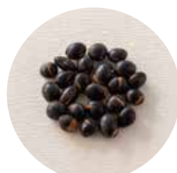
黒豆 Black Beans