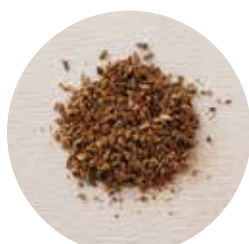
ごぼう Burdock Root