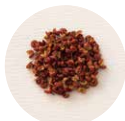
山椒 Japanese Pepper