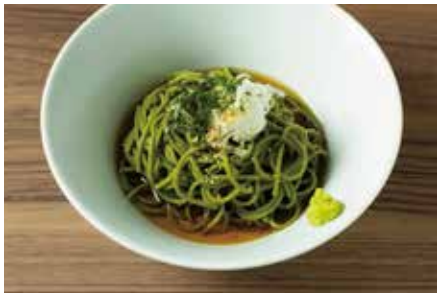
茶蕎麦 750 Tea-Favored Buckwheat Noodles

白出汁で調味したチーズをたっぷり絡めた抹茶讃岐うどん。明太子、季節の野菜をトッピング。