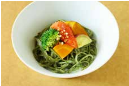
オススメ! 抹茶チーズうどん 1,200 MATCHA Cheese Udon-Noodles

鯉と昆布の旨味を巧みに引き出し、アクセントに和のスパイス『有馬山椒』を加えた1899オリジナルカレーです。