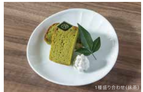
1種盛り合わせ (抹茶)

2種お選びください。 Please choose two ice cream from this list.