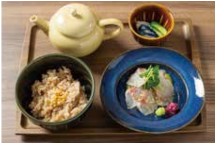
抹茶味噌の鯛茶漬 1,480 Sea Bream CHAZUKE

鯛茶漬を特製抹茶味噌でさらりとお召し上がりください。ご飯を軽く済ませたい時などにもピッタリです。