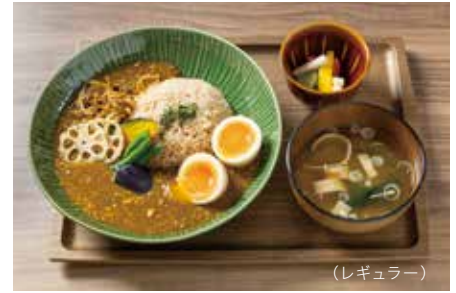
1899和出汁キーマカレー (味噌汁、ピクルス付き) 1899 Special Keema Curry with Seafood Aroma (レギュラー) 1,300 (ハーフ) 980 Regular size Half size

「鹿兒島茶美豚」ならではの、脂の甘味やジューシーな美味しさを丼でお楽しみください。