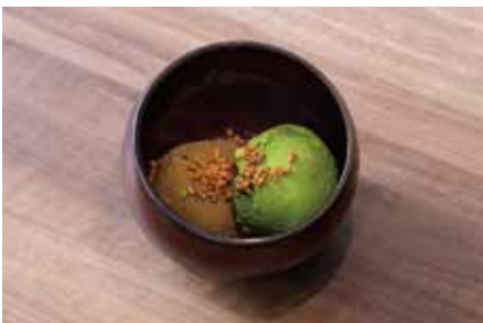
アイス2種盛り合わせ 各500 Two Kinds Assorted Ice Cream

京都府産一番茶の手摘み若芽を石臼挽きした、上質な抹茶を使った濃厚なジェラート。甘さ控えめのぜんざいやサクサクとした食感のおこし種、抹茶あられのトッピングと一緒に。