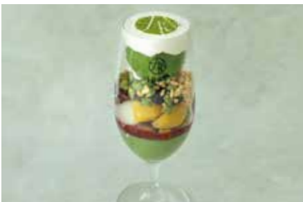
1899 お茶パフェ 1,400 1899 Green Tea Parfait

こだわりの濃厚な濃茶アイスと自家製抹茶プリンなど、様々な抹茶スイーツと和の甘味を合わせた抹茶づくしのパフェ。