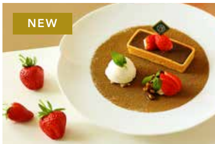
和紅茶タルト 950 Japanese Black Tea Tart

こだわりの濃厚な濃茶アイスと自家製抹茶プリンなど、様々な抹茶スイーツと和の甘味を合わせた抹茶づくしのパフェ。