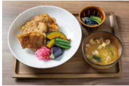
茶美豚丼 (味噌汁、お新香付き) 1,300 CHA-MI-TON Pork Rice Bowl

鯛茶漬を特製抹茶味噌でさらりとお召し上がりください。ご飯を軽く済ませたい時などにもピッタリです。