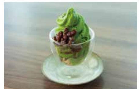
濃茶ジェラート 650 KOICHA Rich MATCHA Gelato

【アイスクリーム】 Ice cream 抹茶、ほうじ茶、ジャージーミルク MATCHA, Roasted Green Tea, Jersey Milk 【シャーベット】 Sherbet 挽き茶 HIKI Green Tea