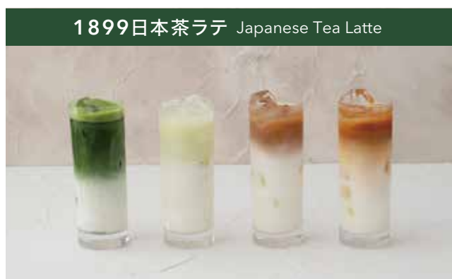
1899日本茶ラテ Japanese Tea Latte