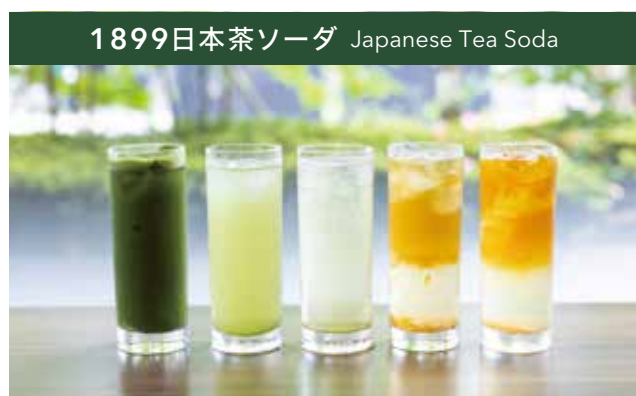
1899日本茶ソーダ Japanese Tea Soda

たっぷりの茶葉を濃く浸出させた和紅茶の華やかな香りや優しい味わいに牛乳の甘みが良く合います。後味がさっぱりとしたラテ。